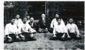
1955年頃、合気神社の前で

毎年4月29日に、合気神社で行われる例大祭では、合気会の道主自らが奉納演武を披露し、国内外から多くの方が集まります。